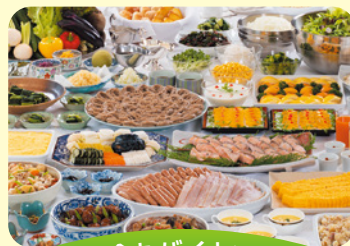
朝食もバイキング

レストラン(フォレストガーデン)にて食べ放題&飲み放題。繁忙期は17:00~17:30入場、19:00~19:30入場の2部制となります。(19:30最終入場)ご到着時先着順で時間のご案内を致します。※お日にちによってご案内時間は変更となる場合がございます。