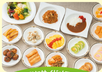
豊富なサイドメニュー