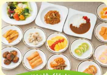
豊富なサイドメニュー