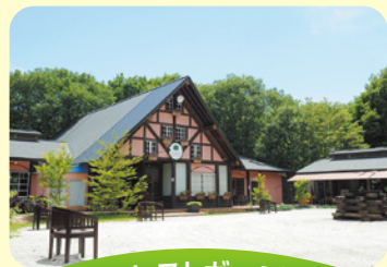
フォレストガーデン